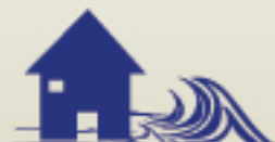
Aumento del nivel del mar