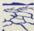
Sequías intensas y prolongadas