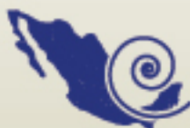
Huracanes con mayor intensidad