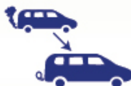
Programas de verificación vehicular