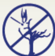
Prevención y combate de incendios forestales