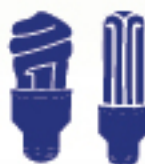
Uso eficiente de la energía