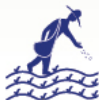
Mejora de prácticas agrícolas y ganaderas