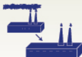
Reducción de emisiones contaminantes