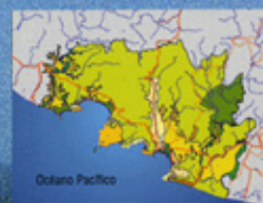
Ejemplo Bani de Sanidad-Tehuacana

INSTITUTO NACIONAL DE ECOLOGÍA Dirección General de Ordenamiento Ecológico e Impacto Ambiental / Delegación Federal de SEMARNAP