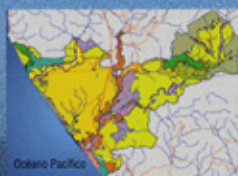
Ejemplo San Sebastián-Cajón de Peñón